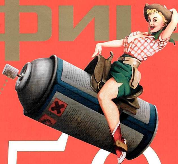
Бэнкси Spraycan Rodeo Girl